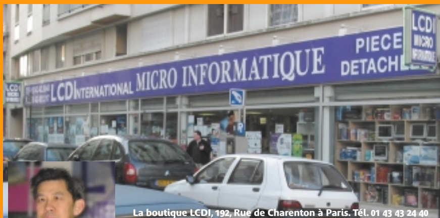
La boutique LCDI, 192, Rue de Charenton à Paris. Tél. 01 43 43 24 40